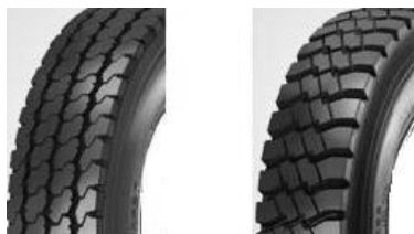
Figura 01 - Imagens ilustrativas.

Devem ser equipados com pneus direcionais no eixo dianteiro e travetos no eixo traseiro (Figura 01).