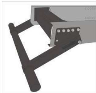
Figura 03 - Imagem ilustrativa.

Para atender a especificação do ângulo mínimo de saída o ônibus pode contar com pára-choque traseiro retrátil (Figura 04).