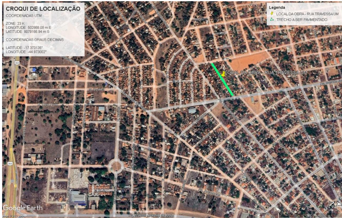
Figura 1: Croqui De Localização

O trecho a receber a pavimentação é a Rua Travessa UM, no Município de Buritizeiro-MG, conforme croqui de localização abaixo.